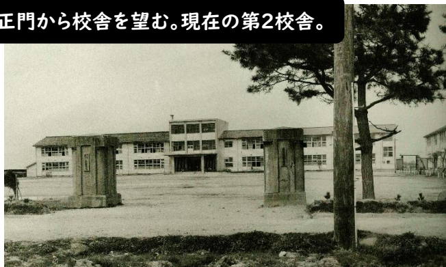
正門から校舎を望む。現在の第2校舎。

1961年4月15日に第1回入学式を迎えました。校舎も未完成であり、中央自動車学校の一部を借りて授業開始したそうです。